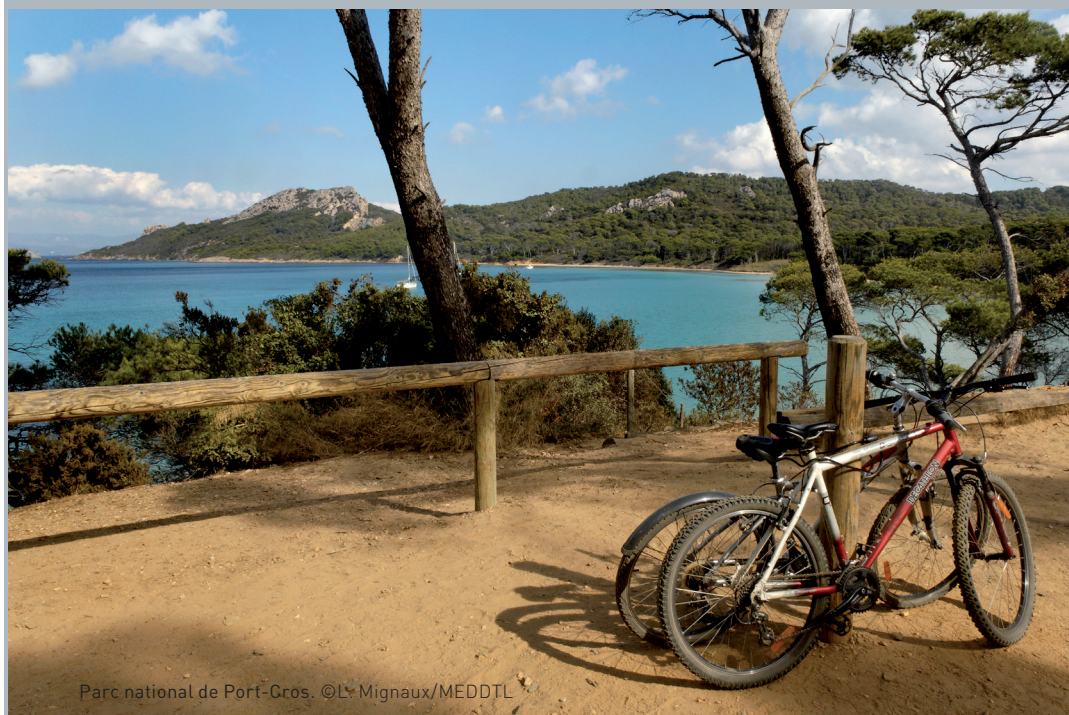
Parc national de Port-Gros.