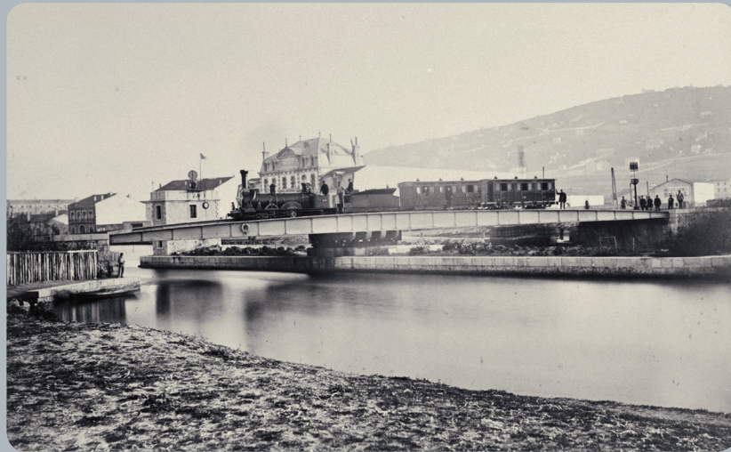
Pont tournant de Cette [Compagnie du Midi]. Ministère des travaux publics, vues photographiques Aude, Hérault, Gard, Vaucluse, Ardèche