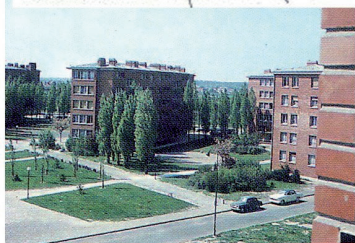
La Cité de la Plaine